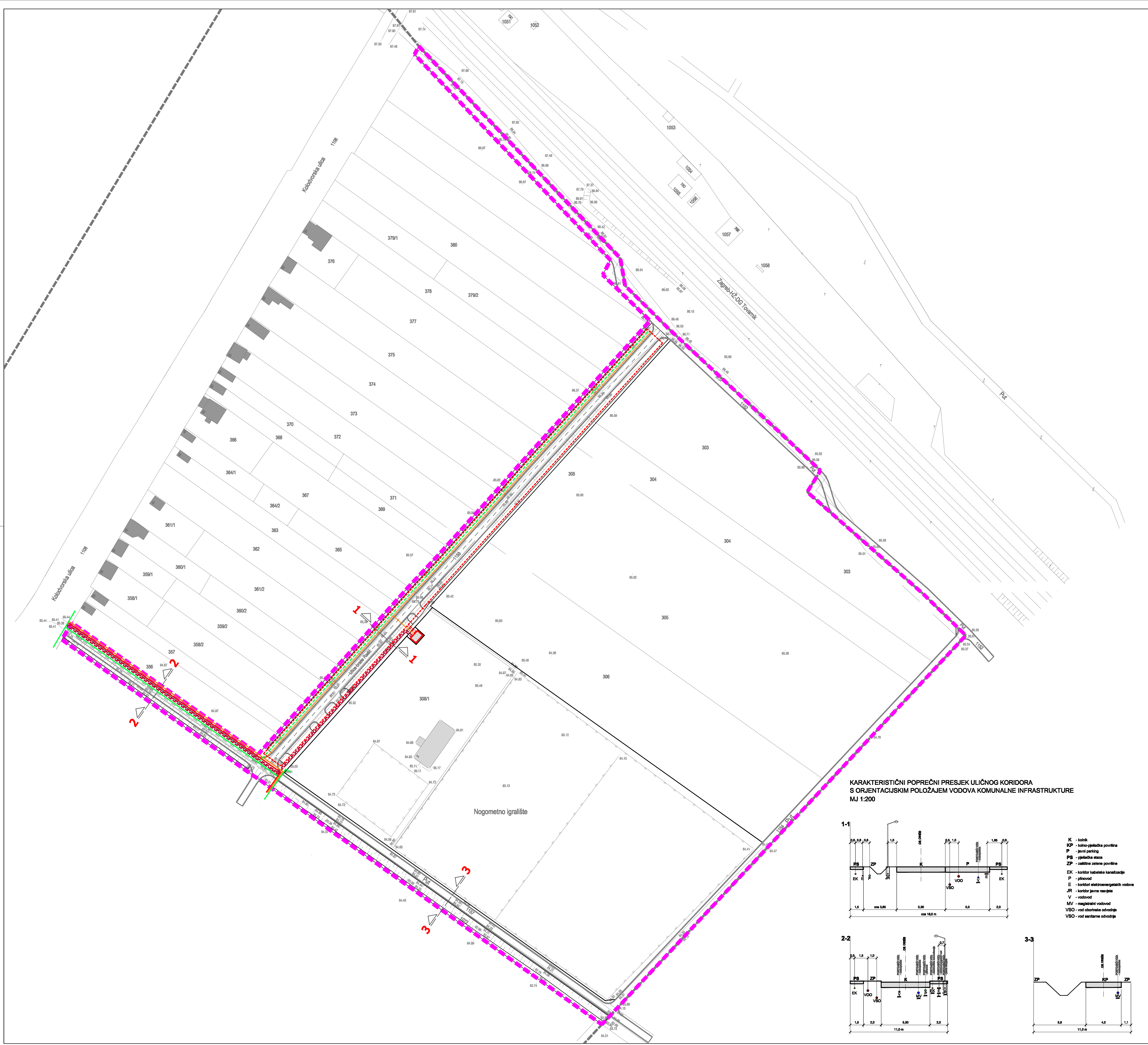
KARAKTERISTIČNI POPREČNI PRESJEK ULIČNOG KORIDORA S ORIJENTACIJSKIM POLOŽAJEM VODOVA KOMUNALNE INFRASTRUKTURE MJ 1:200